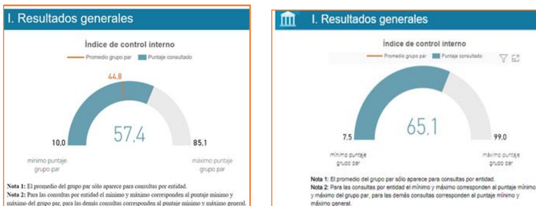
Figura 1 - Comparación de resultados IDI 2020 (Izquierda), 2021 (Derecha)

Los resultados generales de la evaluación FURAG II se observan a continuación en el cuadro comparativo: